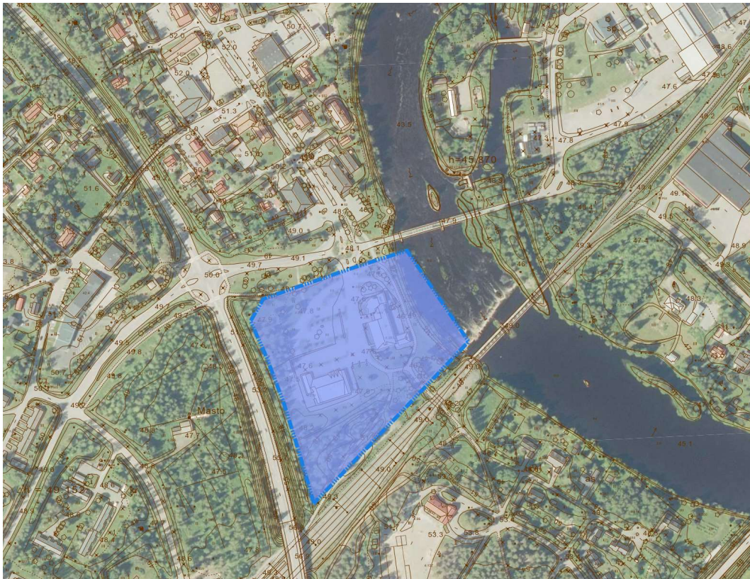
Kaava-alue. Kaava-alueen likimääräinen sijainti on korostettu sinisellä.

Tehtävänä on laatia asemakaavan muutos, joka mahdollistaa asuin-, liike- sekä toimistorakentamisen entisen kunnantalon alueelle. Kaavatyön tavoitteet tarkentuvat työn kuluessa. Suunnittelualue sijaitsee Ruukin keskustaajamassa Siikajoen rannalla. Alueen pinta-ala on n. 3 ha.