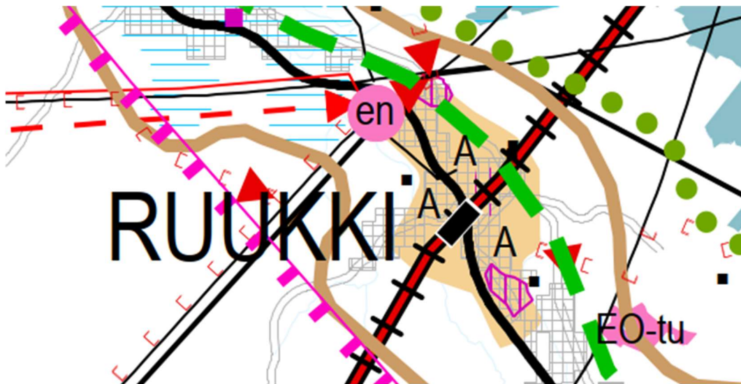
Ote maakuntakaavojen yhdistelmäkartasta (Pohjois-Pohjanmaan liitto, haettu 28.3.2023)

Suunnittelualue kuuluu Ruukin keskustan taajamatoimintojen alueeseen (A).