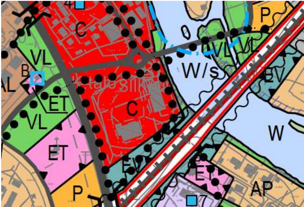
Ote voimassa olevasta Ruukin asemanseudun osayleiskaavasta.